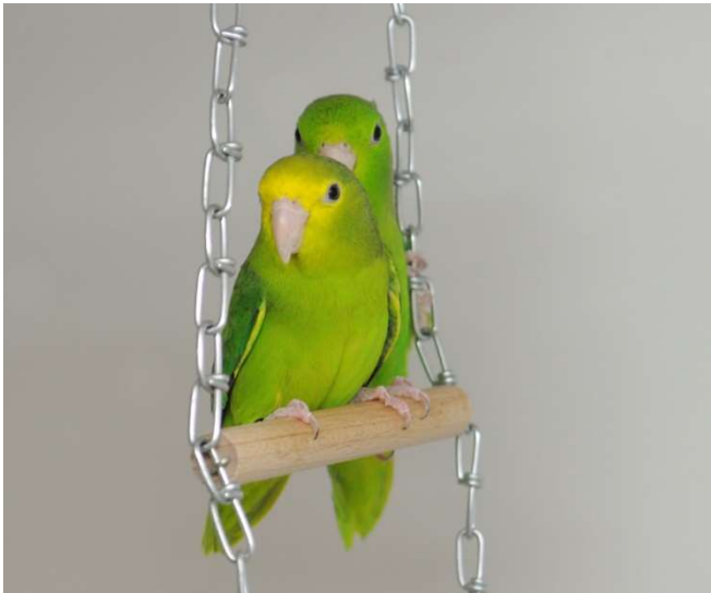
Abb. 1 Forpus spengeli : Henne links, Hahn rechts